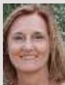
Editorial par Agnès Witko